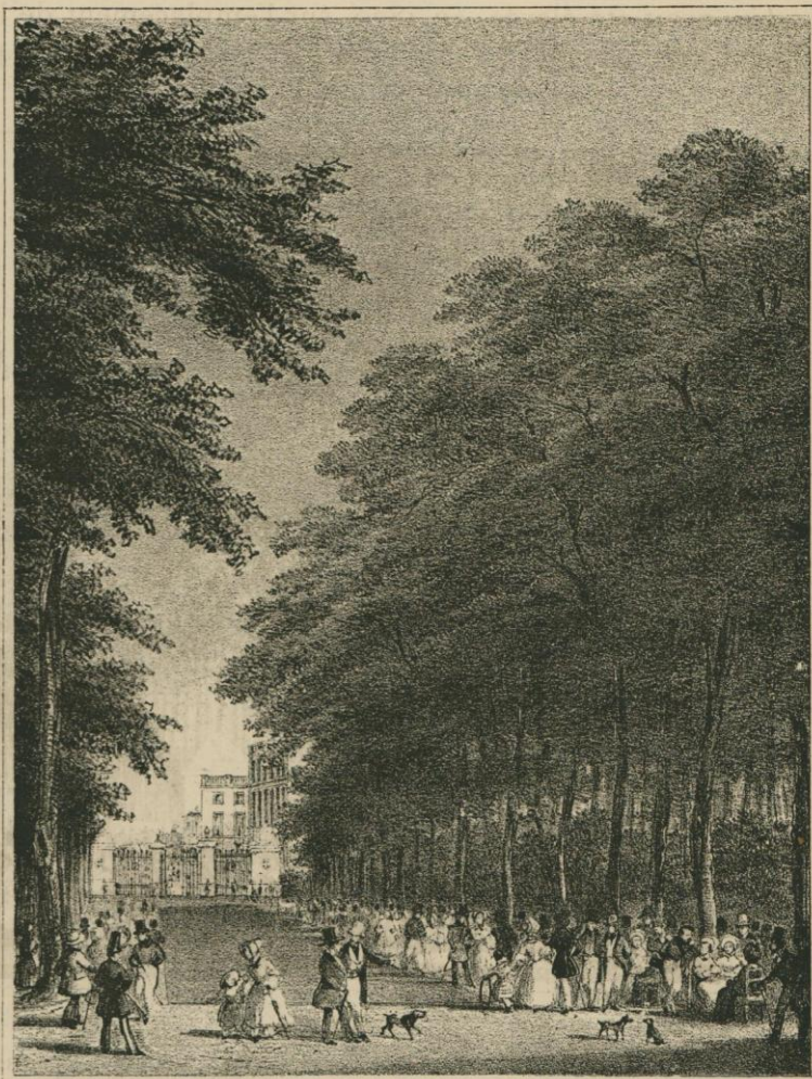
LE PARC A 7 HEURES DU SOIR (1837).